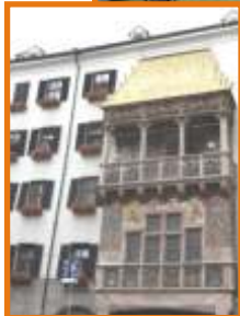
Die Schlösser Neuschwanstein und Linderhof, Godenes Dachl in Innsbruck