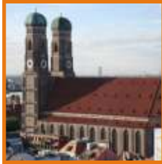
München mit Frauenkirche, Olympiapark

Mögen Sie es etwas aufregender, dann gibt hier auch Paragliding, Ballonfahren und Rafting.